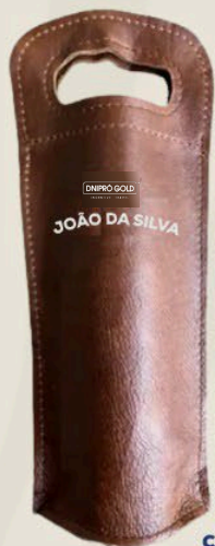
Porta vinhos em couro com nome do participante