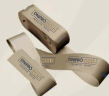
Fita de mala de identificação do grupo

Envio diário de Whastapp com informações da programação