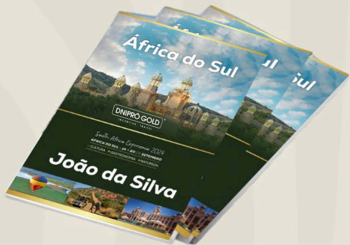
Guia do destino e programação impresso e digital