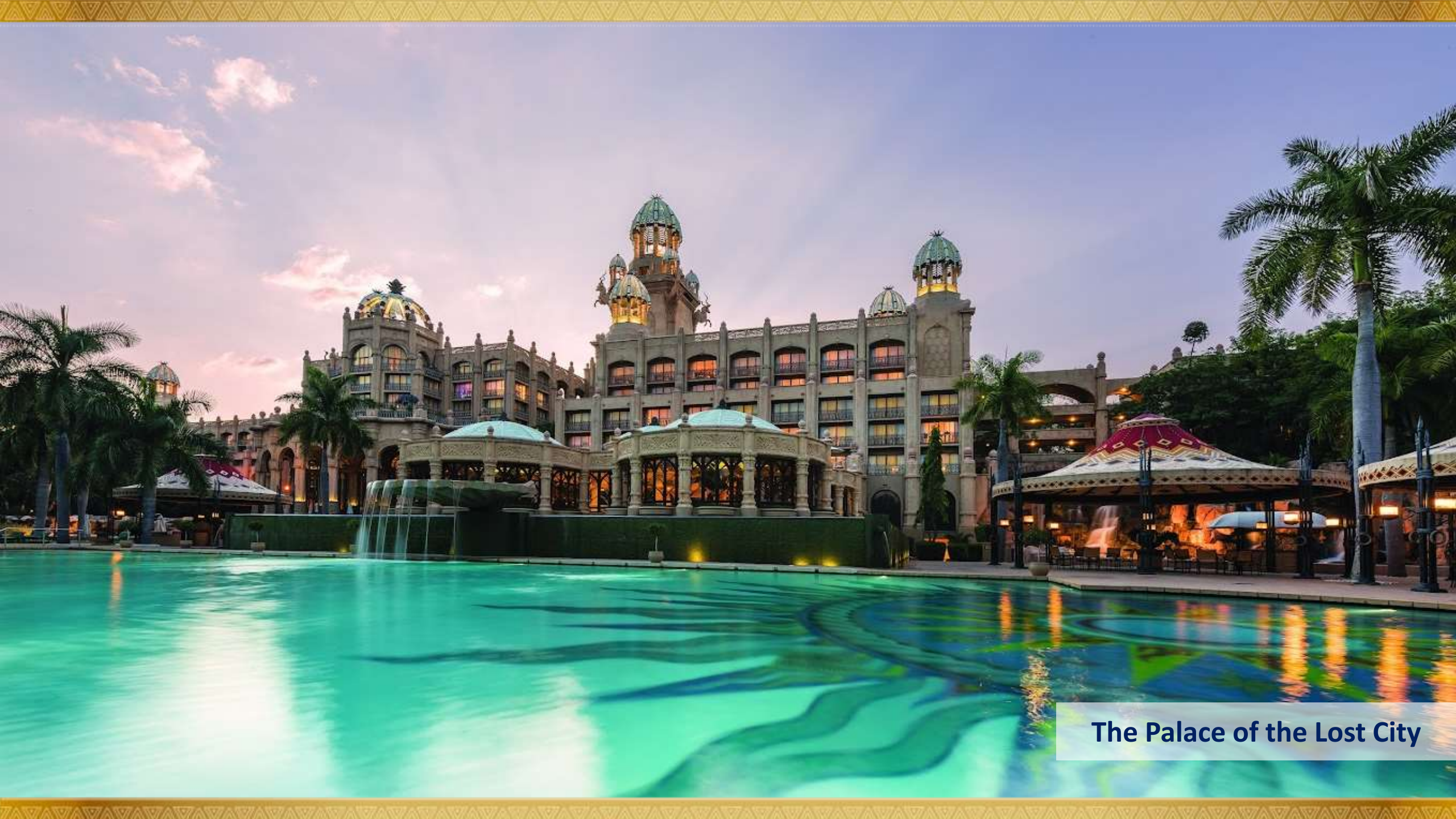
The Palace of the Lost City