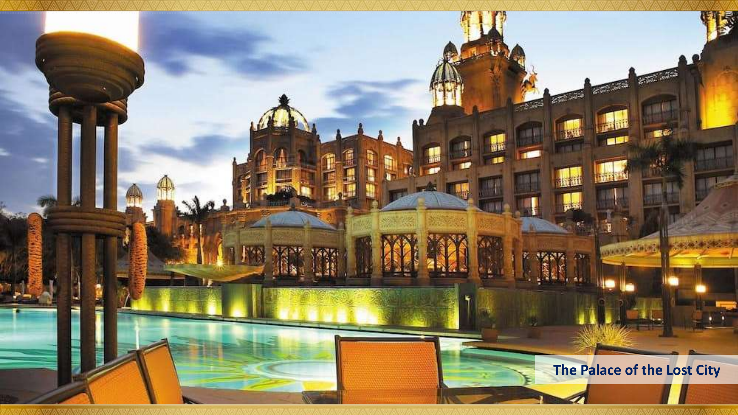
The Palace of the Lost City