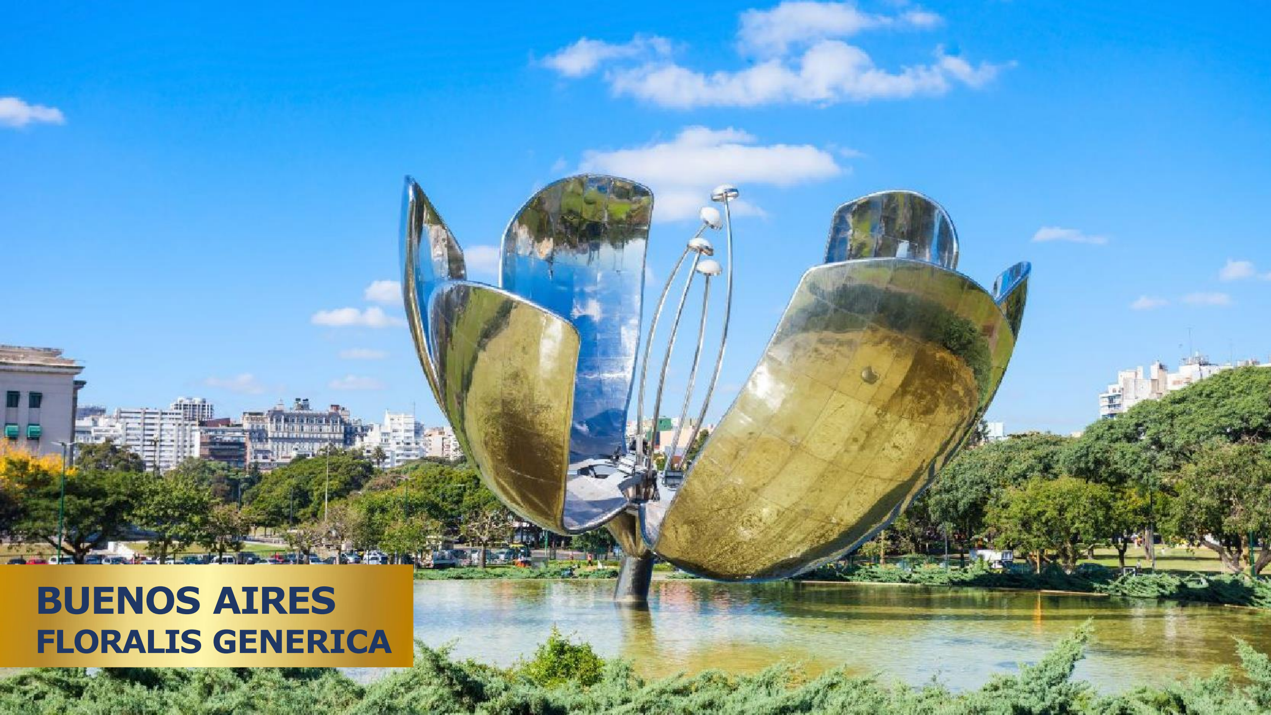
BUENOS AIRES FLORALIS GENERICA